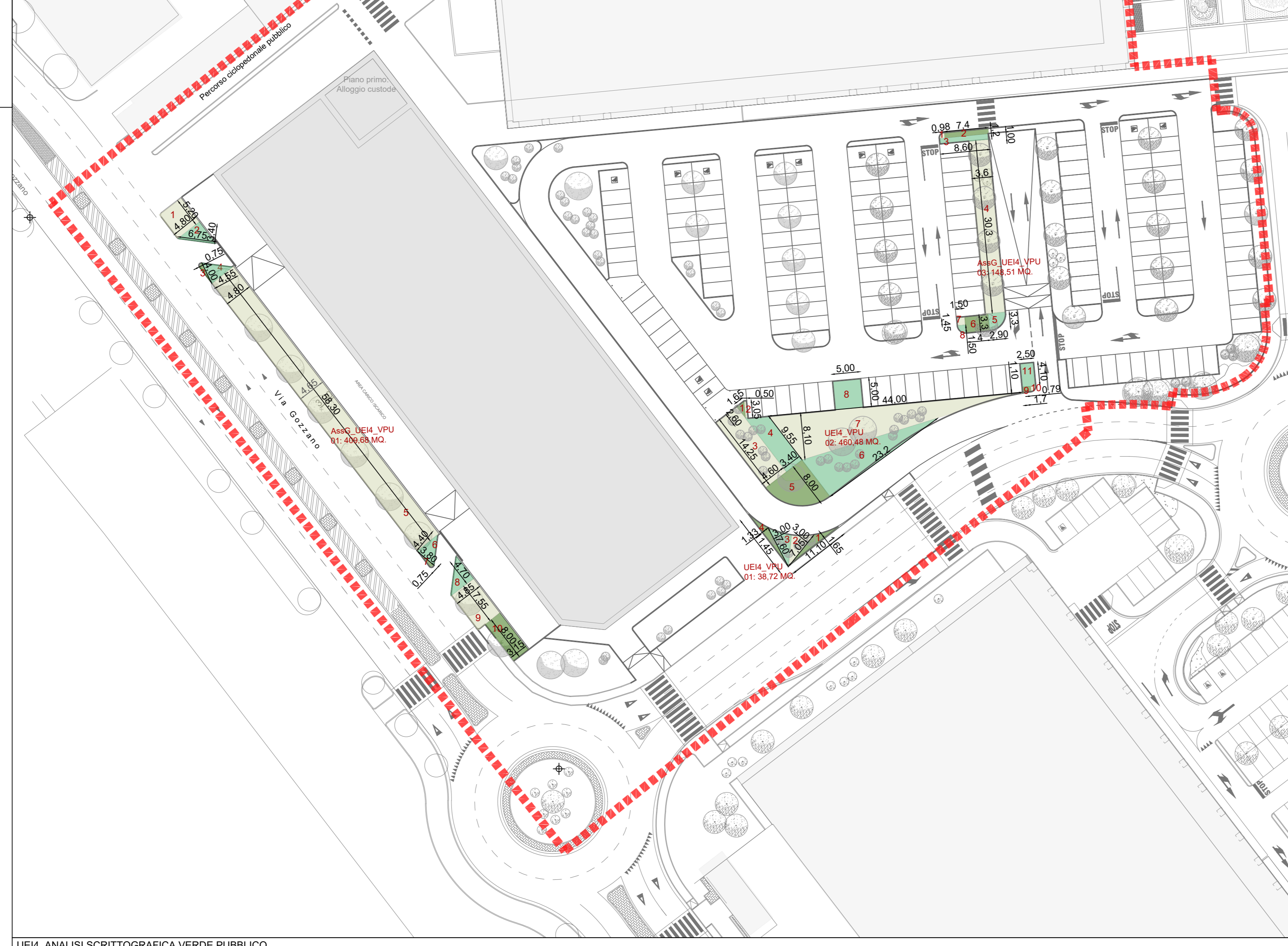
UEI4_ANALISI SCRITTOGRAFICA VERDE PUBBLICO