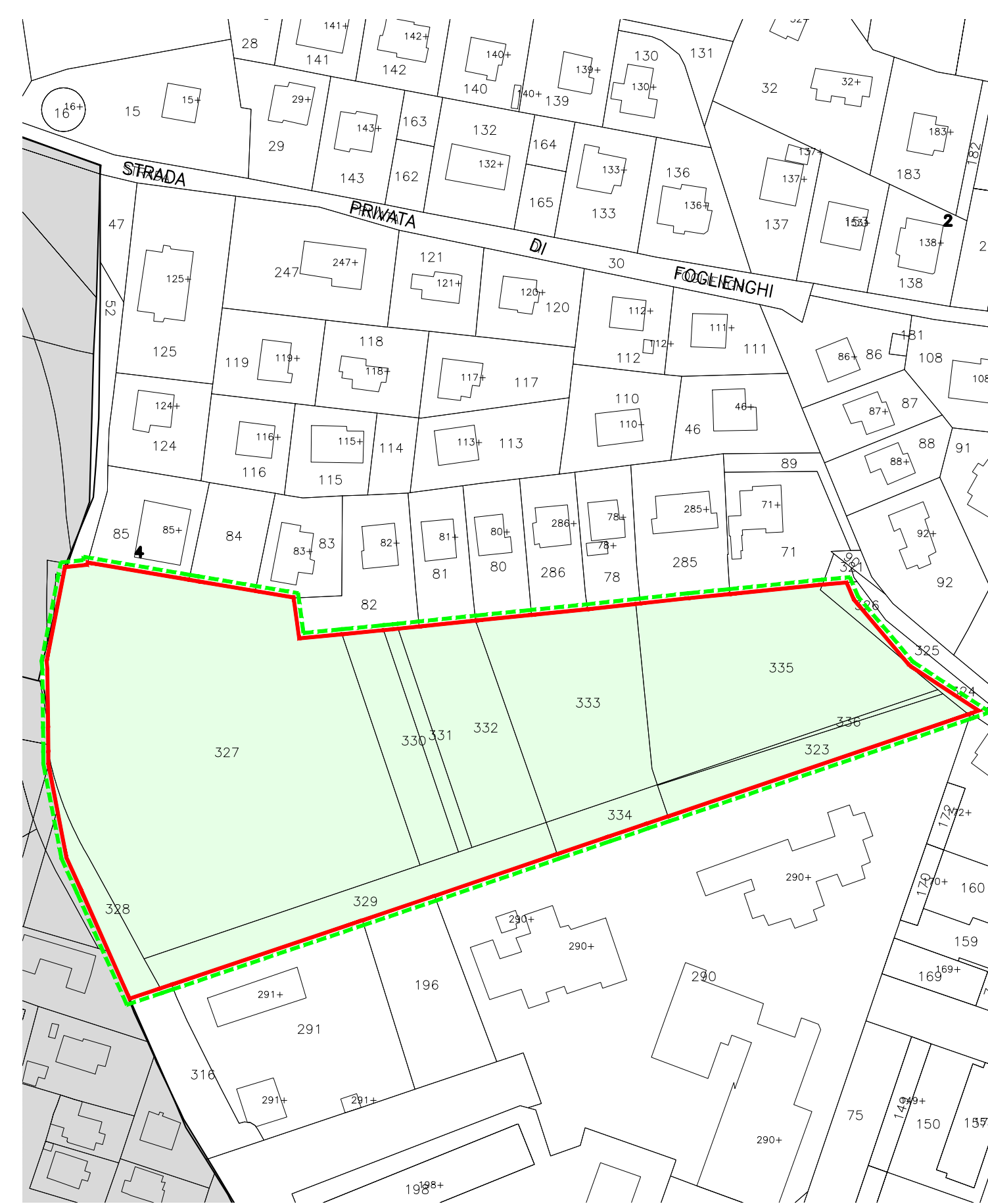
estratto di mappa foglio 41