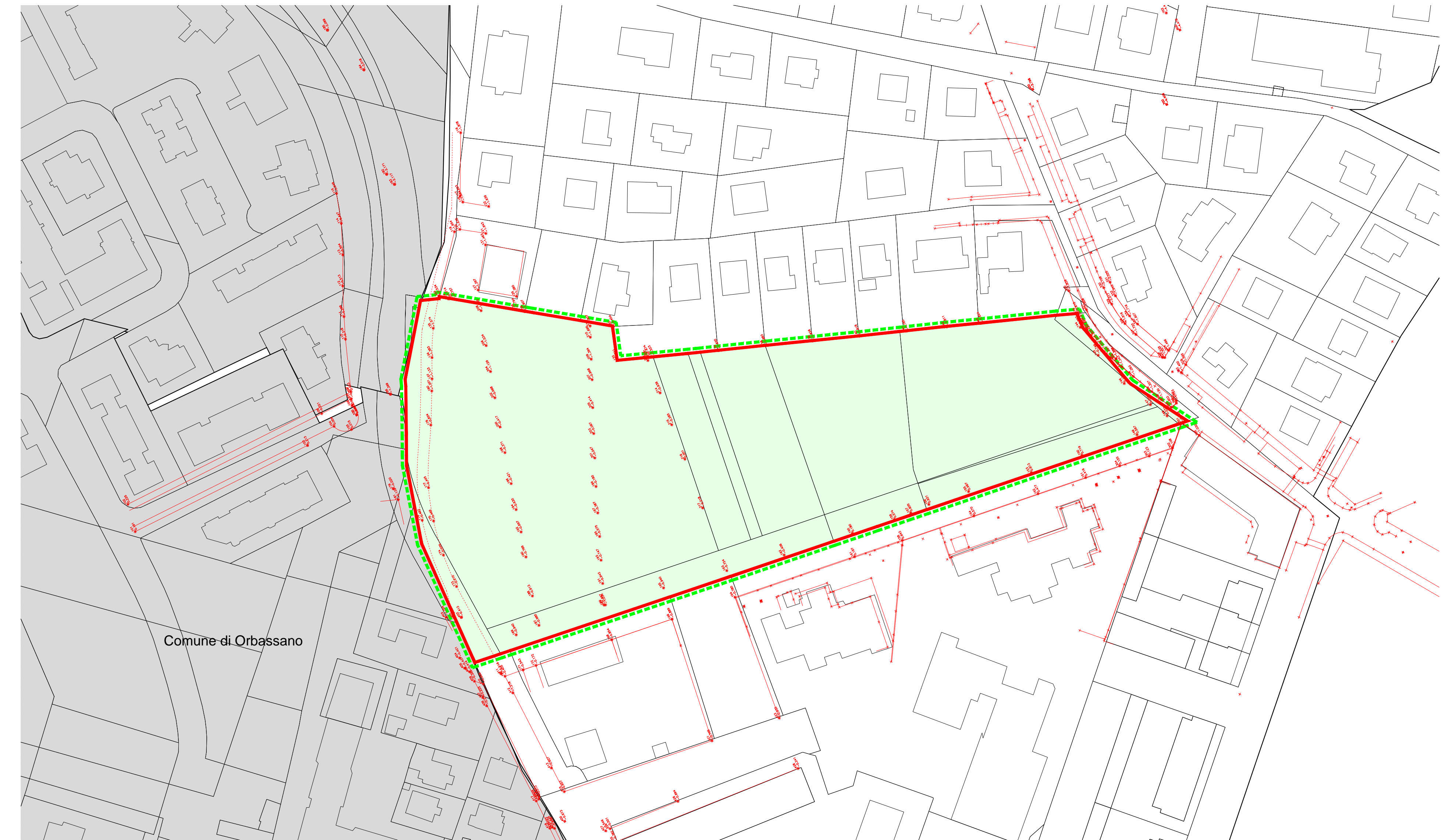
sovrapposizione rilievo - mappe catastali scala 1:1000