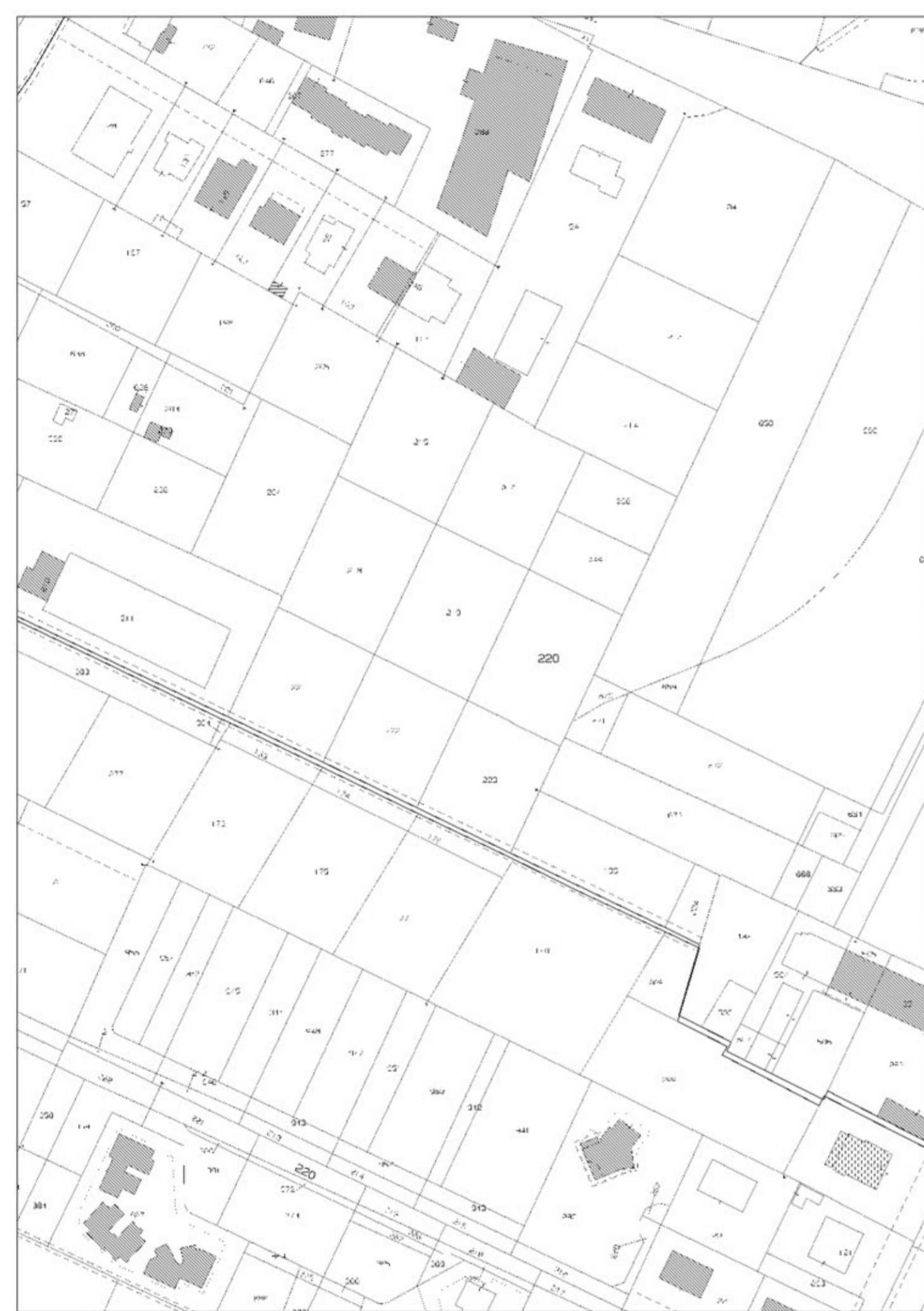
ESTRATTO CATASTALE scala 1:1500

DATA EMISSIONE Settembre 2021 NOME FILE CC6.2_int_Tav2-3-4.dwg SCALA 1:500 TAV.2