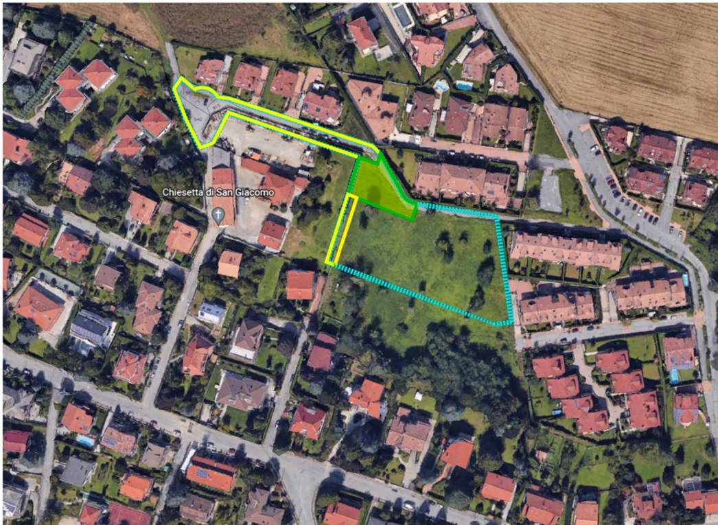
FOTO A_ Vista generale area d'intervento

La relazione fotografica è strutturata come un percorso che parte da via Prugelato e percorre l'area di P.E.C. da OVEST a EST, procedendo dall'ingresso al P.E.C. fino al lotto fondiario.