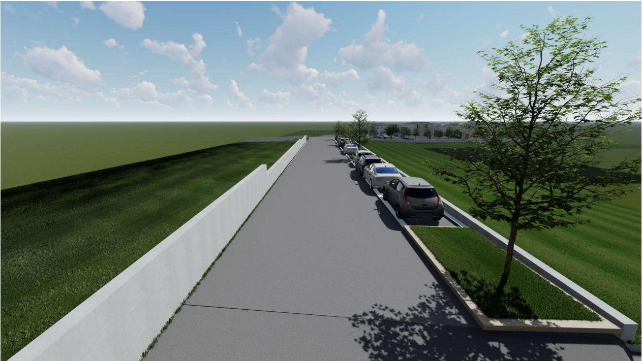
3 _ Area in dismissione S2, passaggio ciclopedonale verso via Domodossola e accesso al lotto fondiario