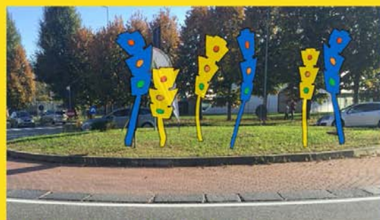
Rotonda su Strada Torino