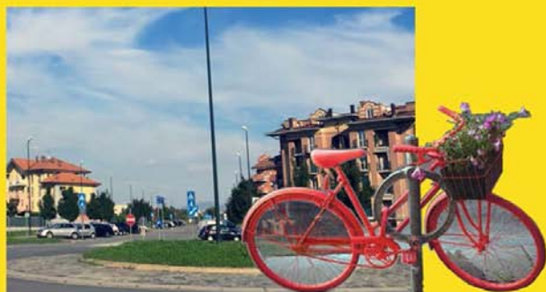
Rotonda di via Aleramo