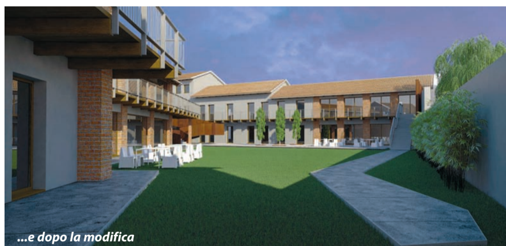
...e dopo la modifica

ai due livelli dell'edificio e dialoga con il ballatoio esterno realizzato in modo più tradizionale in legno, con parapetto in bacchette di ferro. La pavimentazione della corte sulla quale si affacceranno i dehors dei locali, è prevista in parte a verde, in parte in materiali permeabili, con recupero e fitodepurazione delle acque piovane, utilizzate per l'irrigazione, secondo gli studi dell'agronomo Ettore Tisci.