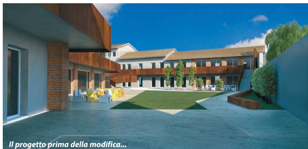
Il progetto prima della modifica...

Il progetto è incentrato sulla valorizzazione della corte che diviene luogo di incontro e di transito pedonale, attraverso un nuovo accesso dalla via Einaudi. Una rampa a gradoni dal disegno fortemente espressivo e moderno permette il collegamento