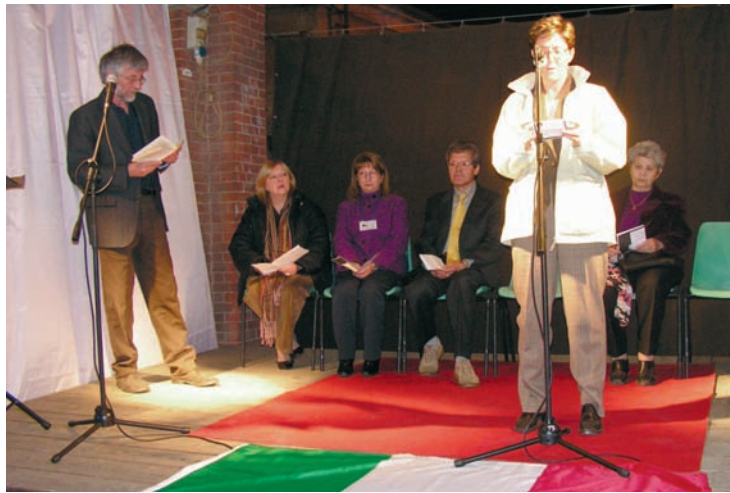
Anche quest'anno il 25 aprile sarà all'insegna della lettura... collettiva, questa volta della Dichiarazione Universale dei Diritti Umani. (Nella foto il reading dello scorso anno)