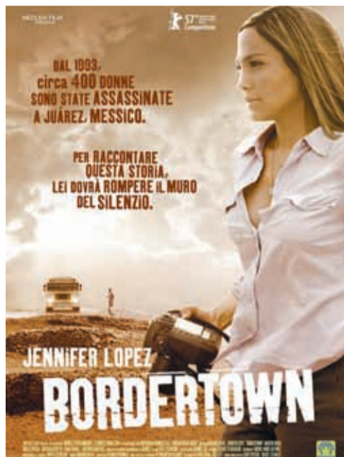
La locandina del film Bordertown , in programma il 29 marzo

L'ingresso a tutte le iniziative è gratuito.