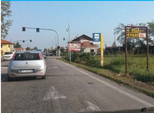
FERMATA VIA GIAVENO