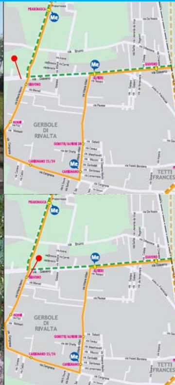
FERMATA CARIGNANO IN VIA ALFIERI